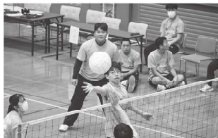
【スポーツ大会 その2】