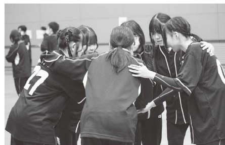
【スポーツ大会 その3】