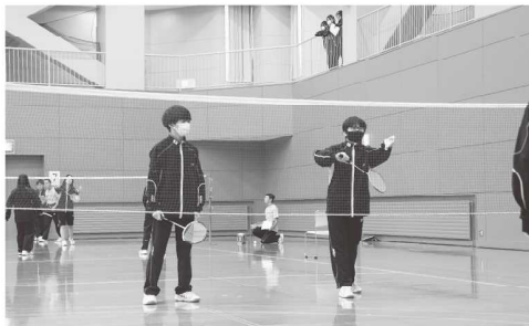
【スポーツ大会 その1】

今年度、スポーツ大会を総合研修センターで実施しました。ミニバレーボール、バレーボールに加え、今年度から新種目のバドミントンも行われ、それぞれの種目で頑張りました。6クラスがスポーツを通して交流し、団結することができたと思います。3年生は卒業前の最後の行事！高校生活の最後の貴重な時間を過ごしました。