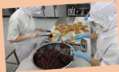
加工施設でどら焼きを作る。