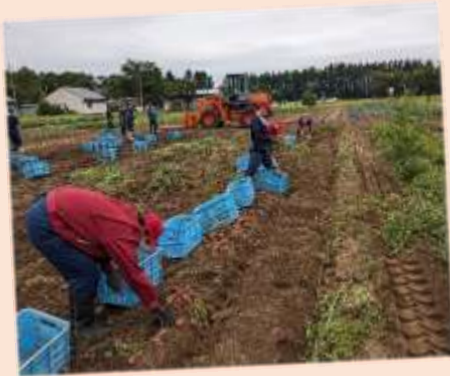
学校の畑で、じゃがいもを収穫する。