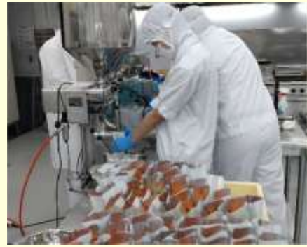
加工施設でレトルトカレーを作る。