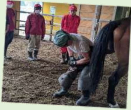
厩舎で削蹄(ひづめを削る作業)を見学する。