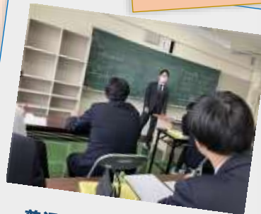
普通科目の授業も充実。