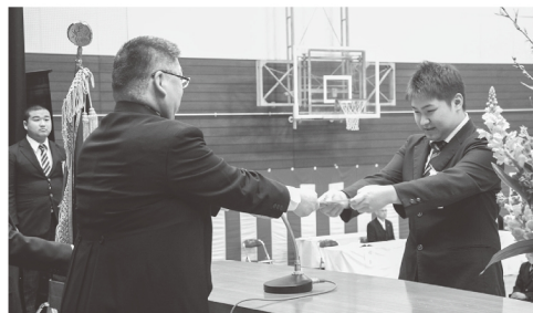
一人ひとりに手渡しで卒業証書を授与しました

本校体育館において、第71回卒業証書授与式を挙行了しました。アグリビジネス科15名、フードシステム科14名、合計29名の卒業生は皆、笑顔でそれぞれの進路に向けた旅立ちの日を迎えることができました。お世話になった関係各位には改めて感謝いたします。