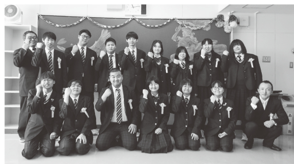
フードシステム科