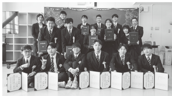
アグリビジネス科

生徒達は多くの人に支えられ、士幌高校で充実した3年間を送ることができました。そして無事に卒業を迎え、授業や行事で得た様々なスキルを持って進路先へと旅立ちます。今後は保護者や地域の皆様の為に活躍する存在へと成長してくれることを願っています。