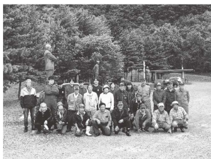
今年は地域の皆さんと一緒に！