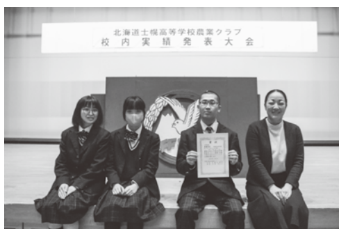
分野Ⅲ類 最優秀賞 地域資源専攻班