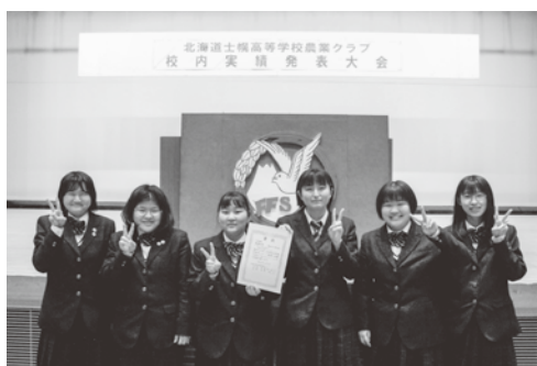
分野Ⅱ類 最優秀賞 農産加工専攻班