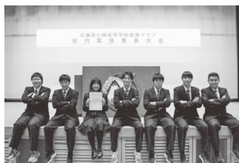
分野Ⅰ類 最優秀賞 畑作専攻班

士幌町総合研修センターを会場に「校内実績発表大会」を開催。10の専攻班と農業クラブ活動および1年生の教科「農業と環境」が、今年1年の研究内容や活動実践について発表を行いました。各分野の最優秀賞を受賞した専攻班は令和5年1月19日～20日に本校を当番校として開催する東北北海道大会に出場します。