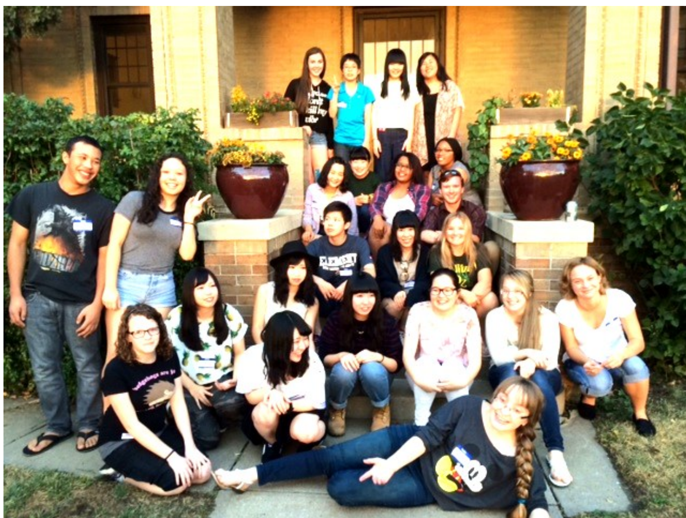
ホストファミリーと共に