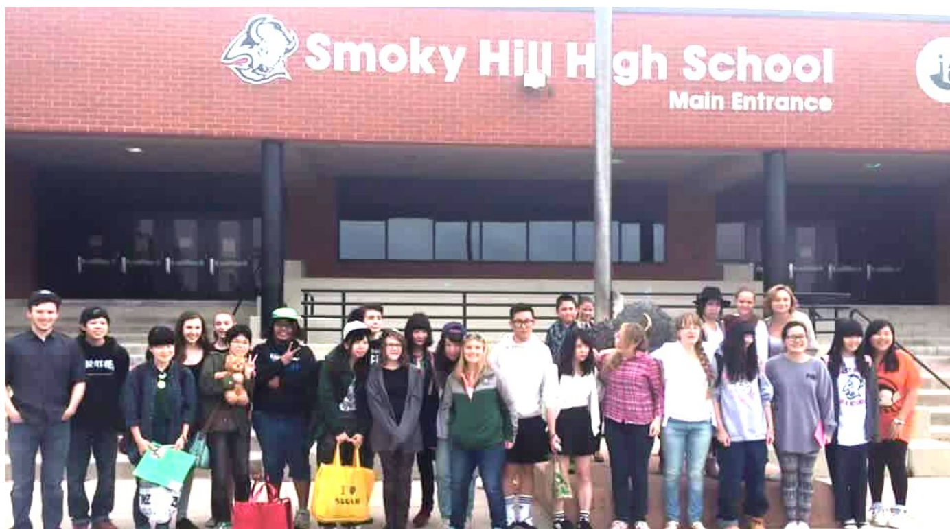
スモーキーヒル高校 校門にて